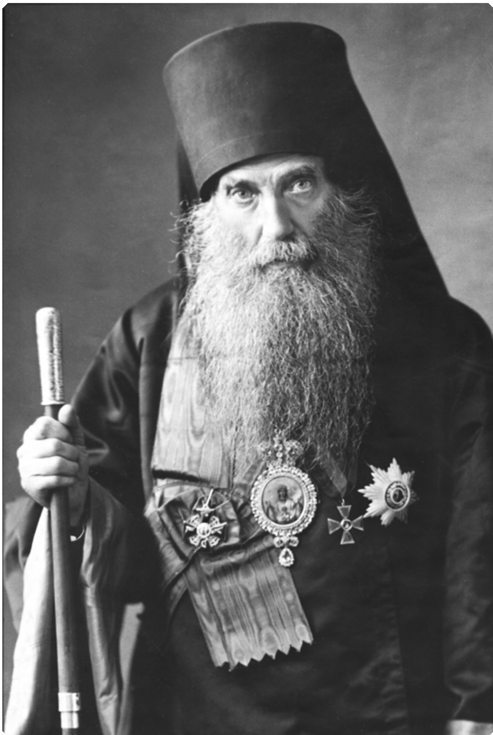
Преосвященнейший Иннокентий, епископ Бийский (Соколов)

Архивные документы и периодические издания свидетельствуют о том, что 12 августа 1914 г., после месячного пребывания в горах Алтая, митрополит Макарий снова вернулся в Бийск, где совершил литургию в Троицком соборе в сослужении Преосвященнейшего