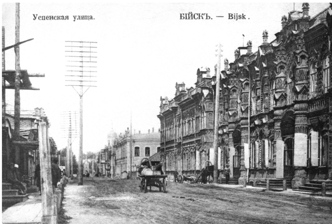
Успенская улица г. Бийска. 1910-е гг. Почтовая карточка. БКМ

Иннокентия, епископа Бийского, и всего городского духовенства. «Во время литургии митрополит возвел в сан протоиерея священника Пальмова и в сан протодиакона – диакона Кикина. После литургии Владыка посетил благочинного бийских церквей отца В. Лебедева, а в час дня отбыл на пароходе «Воткинский завод» в г. Барнаул. К отходу парохода вся набережная была запружена народом».