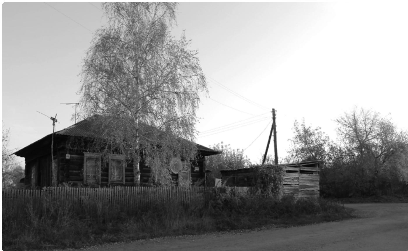
Вид с улицы Школьной на предполагаемое место расположения старой Покровской церкви и кладбища. с. Красный Яр. 2019 г.

«Церковь деревянная, во имя Покрова Пресвятыя Богородицы, построена в 1891 г., земли при ней пахотной и сенокосной 66 десятин (необходимо отметить, что хронологически она не была первой: в «Ведомости о церкви самостоятельной, Покровской села Верхне-Каменского, Бийского округа за 1898 год», хранящейся в Государственном архиве Алтайского края, есть запись о том, что «церковь была заложена в 1857 году, построена на средства прихожан в 1859 г., освящена 15 августа 1860 г. благочинным с. Красноярского Покровской церкви, священником Лаврентием Невским. – авт.).