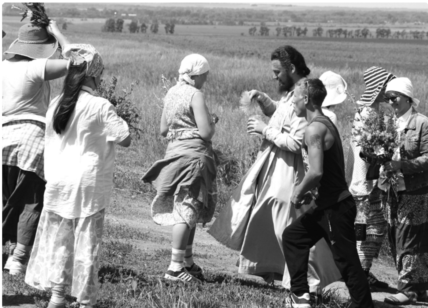
Благословение в дорогу

Лестница в трапезную стала очередным испытанием. Спускаться по ней, как и в дороге идти под гору, было нестерпимо больно. В трапезной было прохладно и просторно. Гречка с овощами была уже не в новинку, но показалась в этот раз необычно вкусной. Мест за столом на всех не хватило, и я прошла в зал воскресной школы. Вокруг были выставлены детские поделки. Вот лежит аккуратно сшитый детскими ручками белый Ангелок, а вот – разноцветные пасхальные яйца с надписью «Христос Воскресе!»