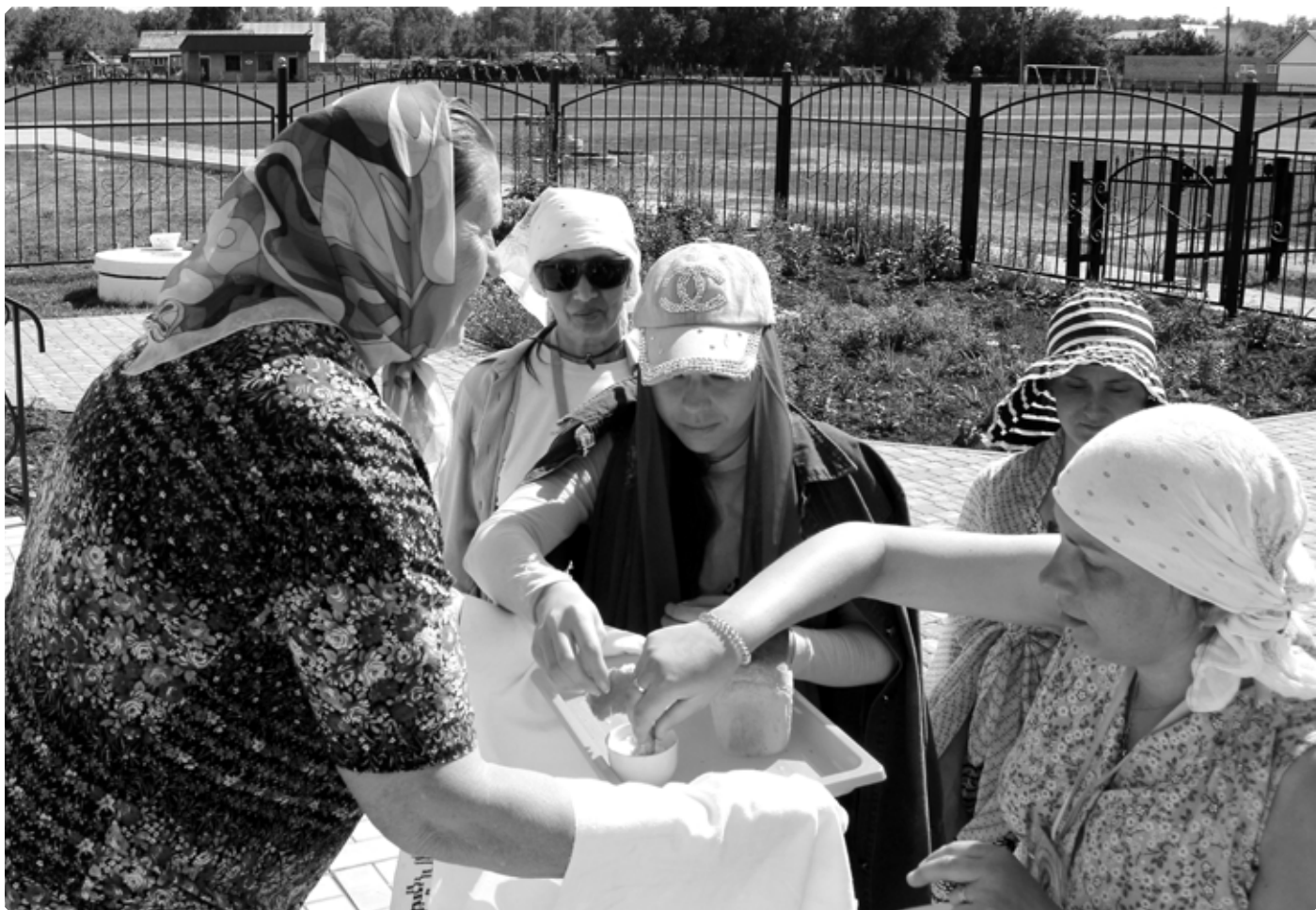
Встреча в Петропавловском

А ведь я помню свою воскресную школу. Как разукрашивала иллюстрации к библейским сюжетам, помню. И почему только родители меня в воскресную школу тогда отдали, ведь сами в Храм не ходили и сейчас не ходят? Странно. Кто кого к Господу и как ведет – одному Ему известно.