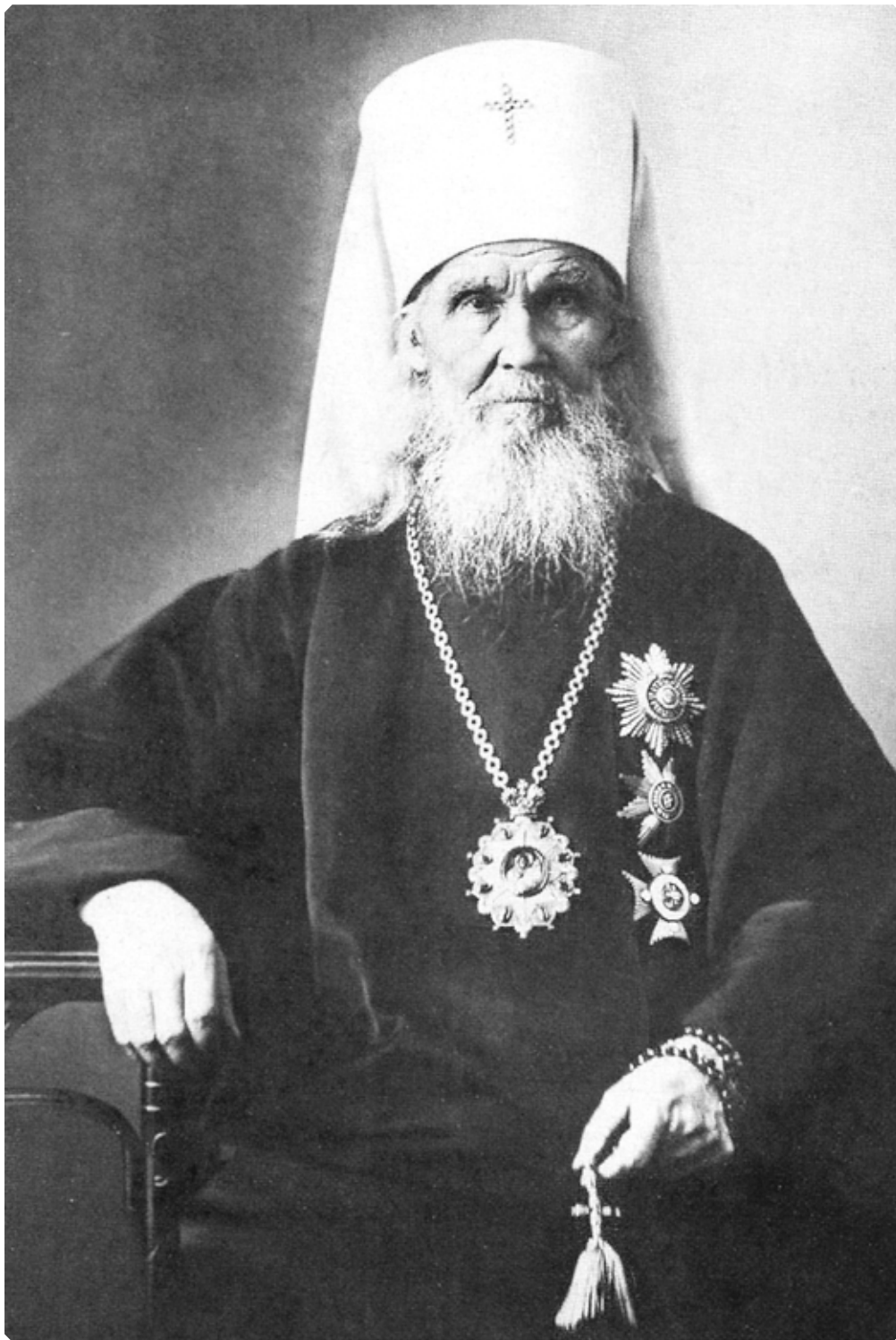
Митрополит Московский и Коломенский Макарий (Невский)

1. За час до прихода парохода во всех церквах г. Бийска начинается благовест в один колокол. Всё градское духовенство является в Собор, имея с собой парадное (желтое) облачение.