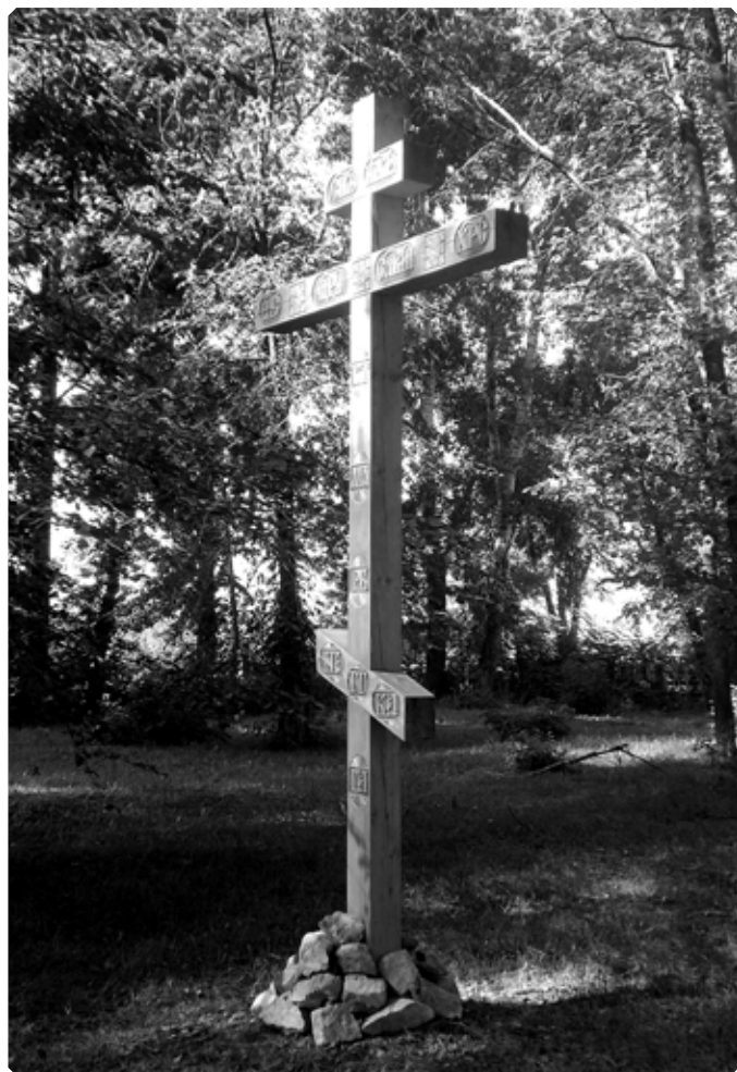
Поклонный Крест на месте разрушенной Покровской церкви в селе Сузоп. Установлен 14 октября 2015 г.

В конце 1930-х годов Покровский храм был закрыт. Приход ликвидирован по постановлению Сузопского сельсовета от 24 апреля 1939 года. Когда ушел из жизни последний священник-миссионер Созоповского стана Косма Укунаков, и как это произошло, неизвестно. По дошедшим до нас рассказам старожилы, батюшка был похоронен в церковной ограде. Храм долгое время стоял в запустении. После разорения храма нашлась женщина, Наталья Ивановна Иешкина, в народе ее называли «Наташенька», которая