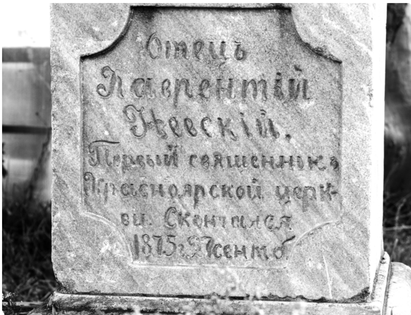
Надпись на памятнике священнику Лаврентию Невскому. Село Советское. 14 октября 2019 г.

«Из Старотырышкинского 1 июня Его Высокопреосвященство проехал в село Красный Яр. Этот приход вполне благоустроен. В нем имеется два храма, из которых один каменный. Имеется церковно-приходская школа. Народ расположен к церкви Божией и усердно исполняет свои христианские обязанности. К сожалению, за последние годы это село начинает испытывать на себе применение новейших способов «просвещения» народа со стороны так называемых, культурных людей. Почтовый чиновник